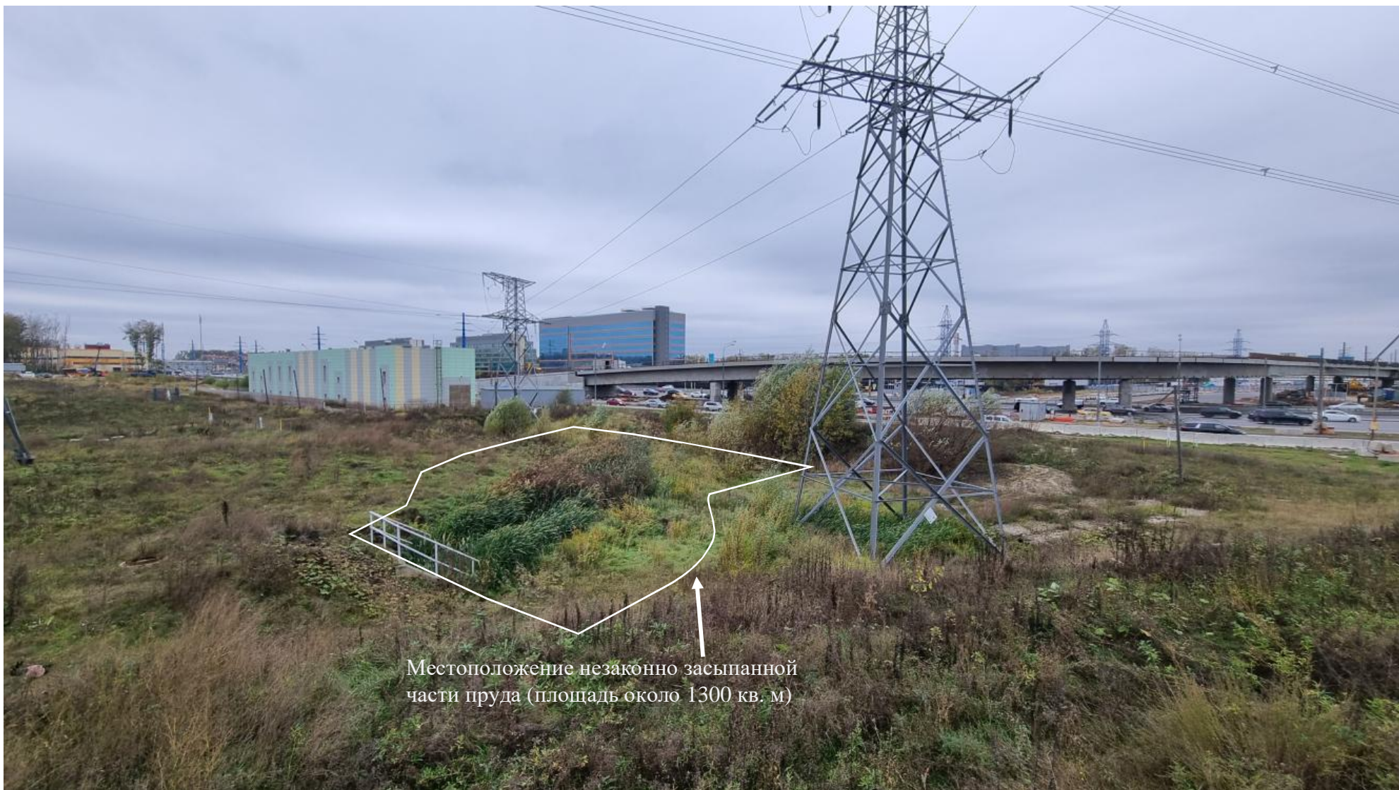
Местоположение незаконно засыпанной части пруда (площадь около 1300 кв. м)